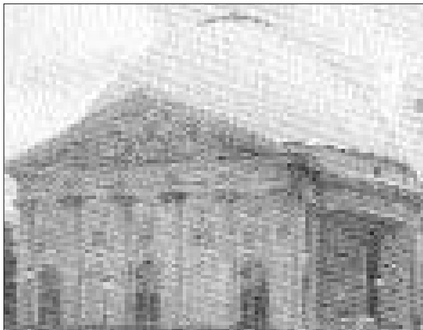
La baselgia catolica da sontga Hedvig a Berlin, bajegiada cun l'agid e tenor plans da retg Fadri II (oz catedrala en la Bebelstraße), dat perditga da sia toleranza.

Retg Fadri I (1657–1713), duca da Prussia (bandiera naira ed alva) e prinzi electur da Brandenburg, ha stgaffì 1700 la premissa principala per surpigliar la dignitad roiala, numnadamain l'accord da l'imperatur tudestg. Pir lur ha'l s'encurunà sez «retg en Prussia», resguardond la suveranità da Pologna sur il ducadi. Encunter lezza promoziun d'in prinzi protestant ha papa Clemens XI (1649–1721) «trames in protest energetic a tuts stadis catolics» (p. 17). Il ducadi da Prussia da lezza giada correspundeva a quai che furma oz l'enclava russa da Caliningrad, plinavant ina sdrima da Pologna ed il sidvest da Lituania; il Brandenburg è oz in pajais federativ tudestg cun Potsdam sco chapitala. Tant la Prussia sco il Brandenburg eran «pajais giuvens (...) cun las vertids tipicas da colonists, numnadamain diligenza, modestadad, premura e disciplina (...)». Il Brandenburg era già vegnì influenzà dal